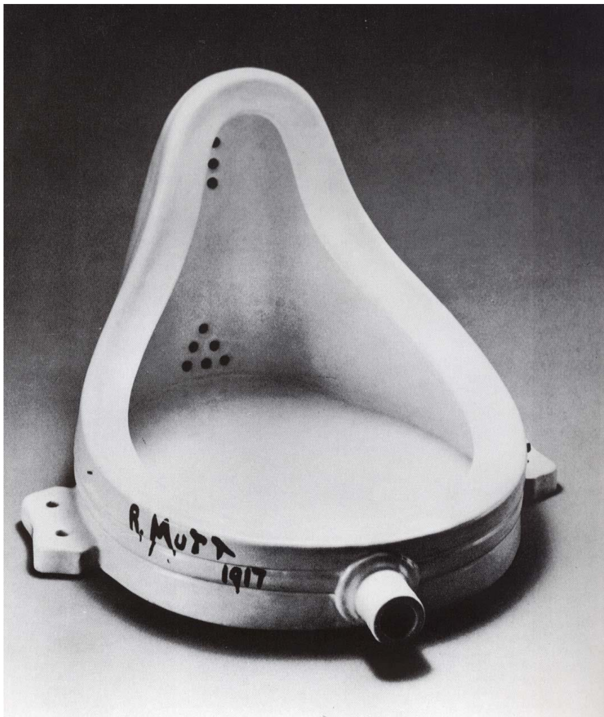
Marcel Duchamp: Fountain , 1917