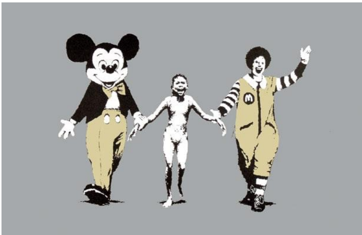
Banksy: Napalm , 2004