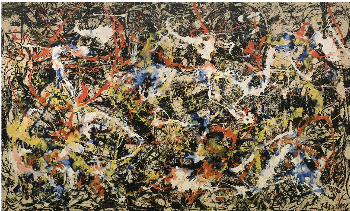
Jackson Pollock: Convergence , 1952